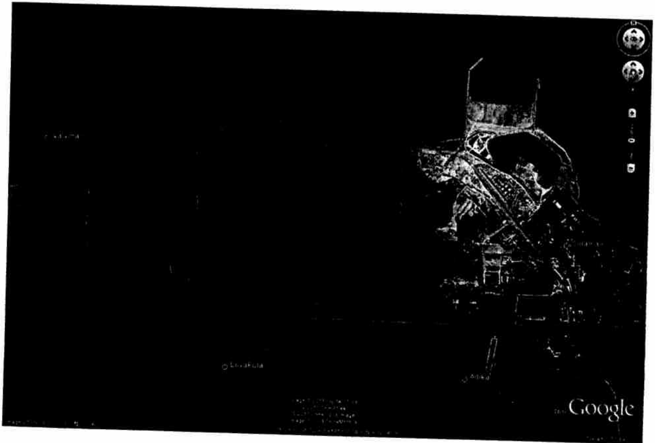
Päite-Vaivina tuulikupark, Toila vald, Ida-Viru maakond

Pildil on kujutatud tuulepargi ala jagatuna kolme tsooni. Vasakul olevasse alasse võib paigutada tuulegeneraatoreid maksimaalse kõrgusega kuni 115 m. Keskmises alas võib tuulegeneraatori maksimaalne kõrgus olla kuni 125 m. Ning parempoolses alas kuni 135 m.